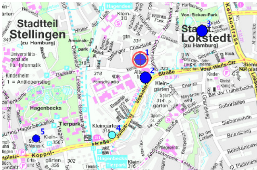
Einrichtungen im Nahbereich

Der wirtschaftliche Erfolg einer Pflegeheim-Immobilie hängt wesentlich von der Philosophie des Trägers und dem Management des Betreibers ab. Bedarf und Angebot am Standort sind die wichtigsten äußeren Faktoren. Gewinnen Sie schnell einen belastbaren Eindruck von Wettbewerb und Potenzial!